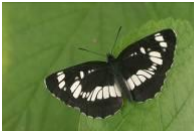
Schwarzer Trauerfalter, bereits am FH-NE gesichtet

Nach der Schmetterlingsdatenbank von DI Dr. Höttinger wurden in Währing in den letzten Jahren 22 verschiedene Tagfalterarten nachgewiesen. Die Schmetterlingsfauna setzt sich erwartungsgemäß aus weit verbreiteten und häufigen Arten zusammen. Eine Besonderheit der Artenliste ist jedoch der Schwarze Trauerfalter, der nach dem Wiener Naturschutzgesetz sogar „prioritär bedeutend“ ist.