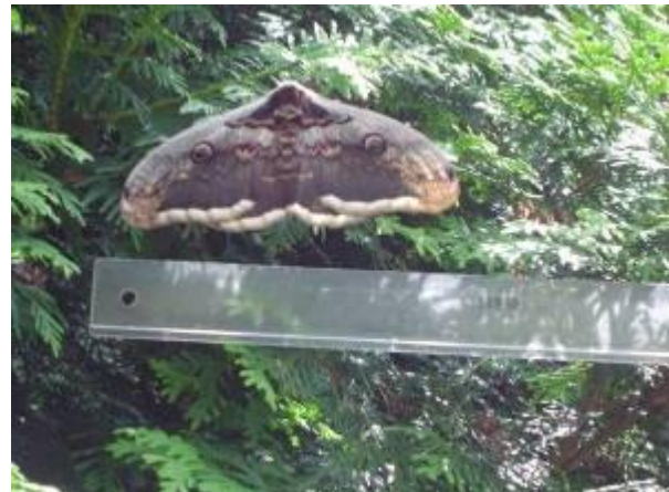
Wiener Nachtpfauenaug, gesichtet am Friedhof Neustift