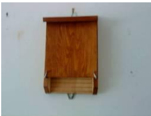
Fledermaus Nistkasten (Model Stratman)

Eine Möglichkeit die Baumfledermäuse zu fördern ist das Ausbringen von Fledermauskästen, die auf Bäumen angebracht werden. Das Modell „Stratmann“ hat sich in der Praxis besonders gut bewährt.