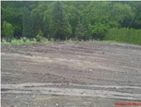
„Gruppe 25“ aufgeschüttet