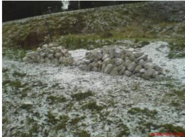
Steinplätze für Reptilien