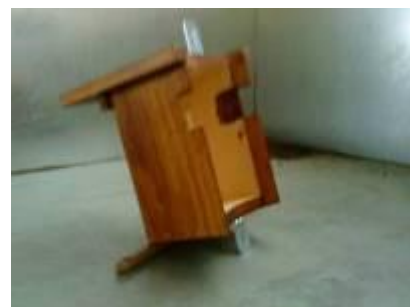
Nistkasten für Baumläufer