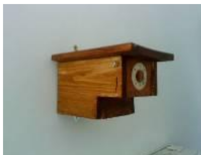
Nistkasten für Höhlenbrüter