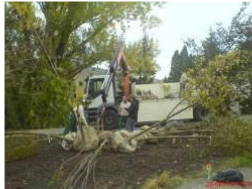
Anlieferung von „Futterbäumen“ für Singvögel und Schmetterlinge