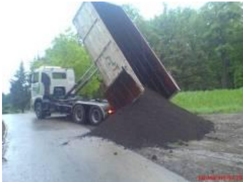
Aufschütten der „Gruppe 25“ mit Humus