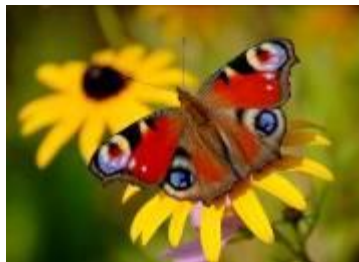
Tagpfauenauge, bereits am FH-NE gesichtet