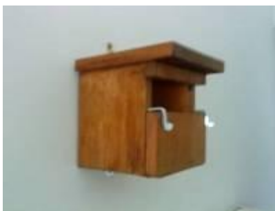
Nistkasten für Halbhöhlenbrüter