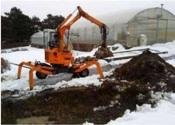
Ausheben des Biotops, im Hintergrund selten gemähte Wiese (Dezember 2009)

Amphibien brauchen fischfreie Kleingewässer für die Laichablage. Für sie wurde im Bereich der Gärtnerei ein speziell als Laichplatz konzipiertes Gewässer angelegt. Wichtig ist auch die Wiese die an den Laichplatz angrenzt. Sie soll deckungs- und nahrungsreicher sein und wird deswegen nur selten gemäht.