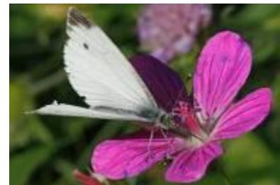
Kleiner Kohlweißling, bereits am FH-NE gesichtet

Der Schwarze Trauerfalter kommt in Wien vor allem in öffentlichen Grünanlagen und Gärten am Stadtrand vor und ist der typische Gartenschmetterling in Wien. In der Roten Listen Niederösterreichs gilt die Art als „gefährdet“, in Österreich steht sie auf der Vorwarnliste.