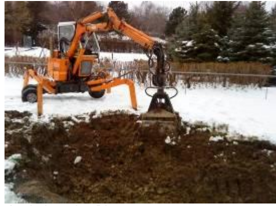
Ausheben des Biotops am Gärtnergelände (Dezember 2009)