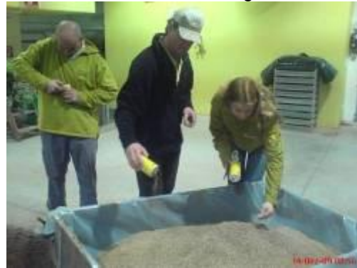
Abmischen von Samen für die Schmetterlingswiese